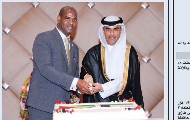
القصفان وسفير غويانا قاطعين كعكة الاحتفال