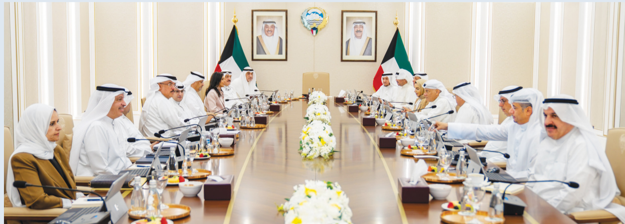
جانب من اجتماع مجلس الوزراء برئاسة اليوسف

في ضوء المتابعة الحثيثة لمجلس الوزراء لكل الأعمال التي تقوم بها الوزارات والجهات الحكومية في ظل الظروف الراهنة، أطلع المجلس على التقارير المقدمة من الوزراء والجهات الحكومية حول الإجراءات التي اتخذت لرفع درجة الجهوية إلى أقصى مستوياتها لضمان سلامة المواطنين والمقيمين وتوفير كافة احتياجاتهم المعيشية نتيجة التطورات العسكرية والأمنية التي تشهدها دولة الكويت والمنطقة.