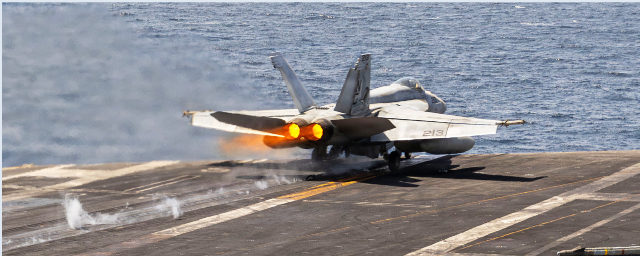
طائرة F35 لدى إقلاعها من حاملة طائرات في المنطقة

أفاد دبلوماسيون بأن مجلس محافظي الوكالة الدولية للطاقة الذرية، المؤلف من 35 دولة، أقر قراراً بشأن إيران بأغلبية 21 صوتاً، مقابل اعتراض 3 دول وامتناع 10 دول عن التصويت. ووفق الدبلوماسيين، يشدد القرار على ضرورة منح الوكالة الدولية للطاقة الذرية «كامل الصلاحيات التي تحتاجها» للتحقق من مخزون إيران من اليورانيوم المخضب. كما يدعو القرار إيران إلى الإعلان عن مخزونها المنبهي من اليورانيوم، في إطار جهود الوكالة الرامية إلى التحقق من التزاماتها النووية وتعزيز الشفافية بشأن أنشطتها النووية. ورفضت إيران القرار ووصفته بـ«المسيس».