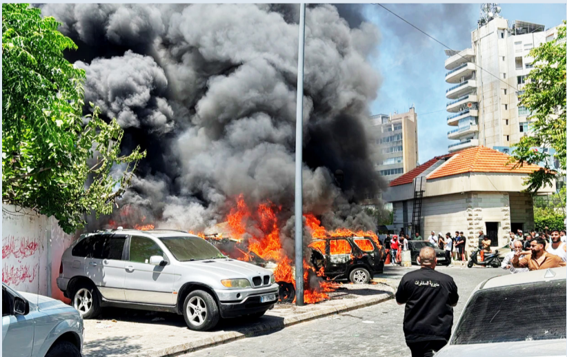
دخان متصاعداً من مركبات محترقة عقب غارة في صيدا

لتثبيت وقف إطلاق نار مستدام، شملت لقاءات مع كبار المسؤولين اللبنانيين، ومن المقرر أن تشهد الأيام المقبلة جولات تفاوضية برعاية أمريكية. في السياق ذاته، أشار السفير المصري في بيروت إلى تقارب في المواقف اللبنانية، قائلاً: «ما سمعته من رئيس مجلس النواب نبيه بري لا يبتعد عن مواقف الرئيس عون ورئيس الحكومة نواف سلام». وتعكس هذه التصريحات توافقاً داخلياً نسبياً حول التعاطي مع المرحلة الراهنة.