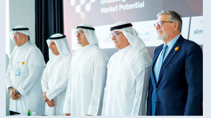
الوزير عبدالعزيز المرزوق متوسطاً بنواف الغريلي والمشاركين في الجلسة

القائمة، بل تمتد إلى بناء منظومة مالية رقمية متكاملة تقوم على بنية تحتية قوية، وشركات وطنية موثوقة، وبيئة تنظيمية تواكب الابتكار وتحافظ على التوازن مع متطلبات الحماية.