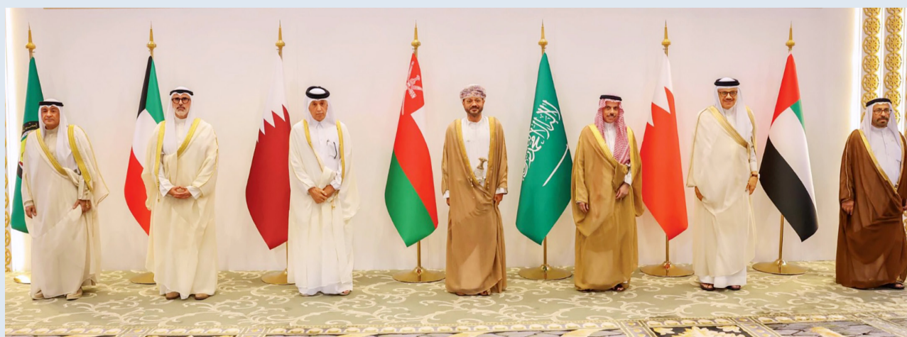
جاسم البديوي وجراح الجابر ووزراء خارجية دول التعاون

أدان البيان الختامي لاجتماع المجلس الوزاري لمجلس التعاون لدول الخليج العربية، في اجتماعه بالبحرين، أمس، باشد العبارات الاعتداءات الإيرانية الغاشمة على الكويت على سيادة الدول وأمن شعوبها وسلامة أراضيها، وانتهاكاً صارخاً للقانون الدولي وميثاق الأمم المتحدة ومبادئ حسن الجوار. ودعا البيان مجلس الأمن والمجتمع الدولي إلى تحمّل المسؤولية في إدانة هذا العدوان ومحاسبة مرتكبيه، مجدداً تمسك دول التعاون بخيار السلام وحسن الجوار والحلول الدبلوماسية سبيلاً لتسوية الخلافات، وأن النمادي في نهج العدوان لن يؤدي إلا إلى مزيد من العزلة، ويغلق أبواب الحوار.