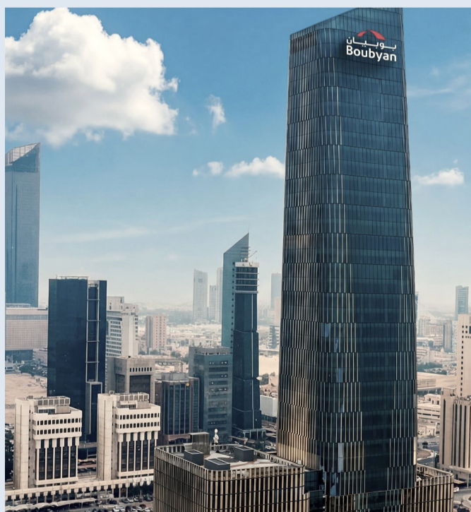
مقر بنك بوبيان الرئيسي الجديد

ويهدف الفرع الجديد إلى تعزيز تجربة العميل في مختلف القرارات والمبادرات التطويرية، انطلاقاً من قناعته بأن القرب من العملاء وفهم احتياجاتهم يمثلان الأساس الحقيقي للنجاح المستدام. وأشار إلى أن هذا النهج انعكس في العديد من الجوائز والتقدير، التي حصدها البنك في مجال خدمة العملاء، وفي مقدمتها جوائز «أفضل بنك إسلامي في جودة خدمة العملاء في الكويت» لعام 2025، وذلك وفقاً لمؤشر «سيرفس هيرو» لقياس رضا العملاء، حيث وأصل بنك بوبيان ترسيخ مكانته كأحد أبرز المؤسسات المصرفية الرائدة في هذا المجال، محافظاً على هذا التميز 16 عاماً على التوالي.