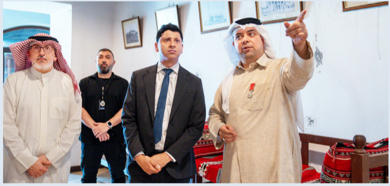
جانب من زيارة قدسي رشيد لبيت ديكسون

قام سفير المملكة المتحدة لبريطانيا العظمى وأيرلندا الشمالية لدى الكويت، قدسي رشيد، بزيارة إلى «بيت ديكسون» مقر المعتمد البريطاني السابق - في إطار تعزيز الروابط الثقافية والتاريخية الممتدة بين الكويت والمملكة المتحدة. وقام الباحث بالعلاقات الكويتية - البريطانية عيسى دشتي، وبحضور الأمين العام المساعد لقطاع الآثار والمتاحف في المجلس الوطني للثقافة والفنون والآداب بالتكليف، محمد بن رضا، بإصطحاب