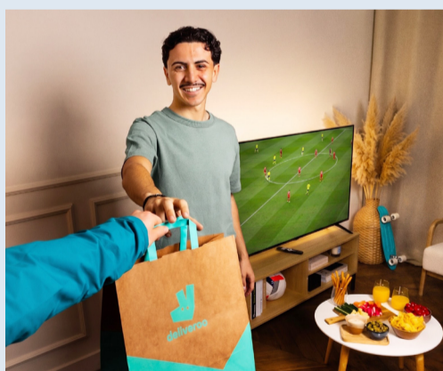
ملصق حملة «استرداد الهدف» من ديليفرو

لا شيء يضاهي إحباط عشاق كرة القدم، عندما يسمعون هتافات الاحتفال بالهدف تتعالى من أمام الشاشة، بينما هم منشغلون بتسلم طلبهم عند الباب. في لحظة تتشغل بتسلم طلبك، وفي اللحظة التالية تتكشف أنك فوت أحد أهم أهداف البطولة، هذا الصيف، تحوّل ديليفرو هذه اللحظة المألوفة لدى الكثير من المشجعين إلى سبب للاحتفال، من خلال إطلاق حملة «استرداد الهدف».