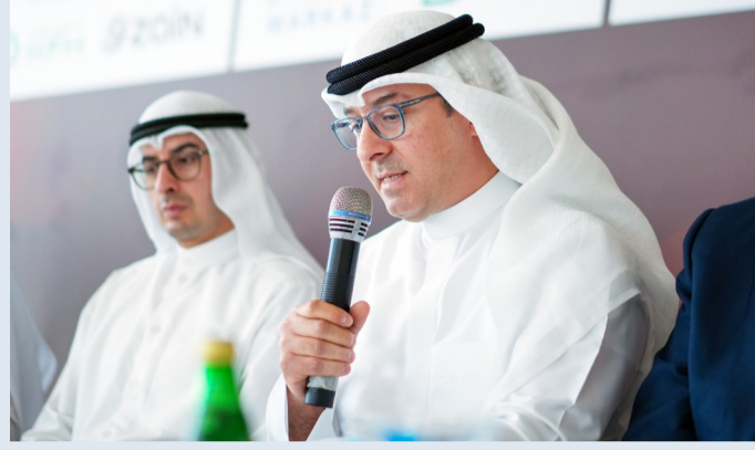
الغريلي فتحدثاً خلال الجلسة