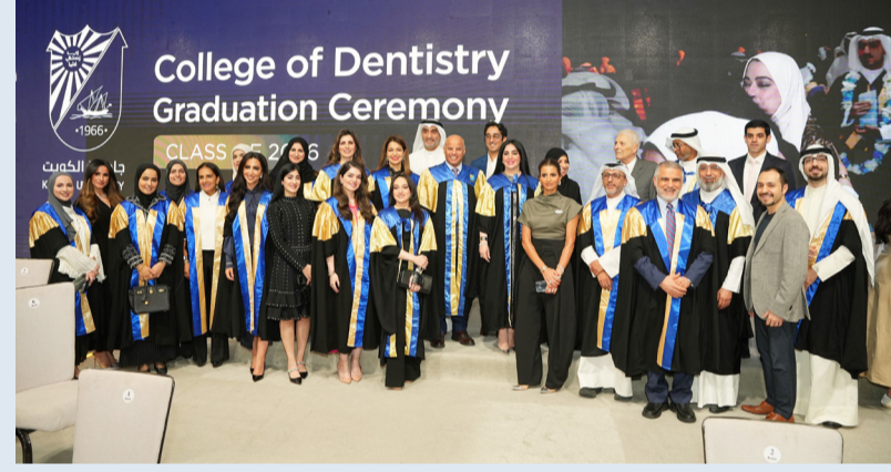
صورة جماعية للخريجين

وخلال الحفل، احتفلت stc مع الخريجين بتقديم مجموعة من الهدايا التذكارية تقديراً لهذه المحطة المهمة في مسيرتهم الأكاديمية، كما عرضت الشركة مجموعة من أحدث خدماتها وحلولها الرقمية من خلال جناحها التفاعلي، الذي لاقى إقبالاً كبيراً من الطلاب والضيوف على حد سواء، مسلطة الضوء على المنتجات والخدمات المصممة لتلبية الاحتياجات والتطلعات المتغيرة لشباب الكويت. يتسجد دعم stc لحفل التخرج مع التزام الشركة المستمر بتعزيز التعليم وتمكين شباب الكويت، وتعد هذه المبادرة جزءاً من استراتيجية الشركة الأوسع نطاقاً للاستثمار في تنمية قادة ومبتكري المستقبل، الذين سيساهمون في نمو الوطن وتقدمه. وانطلاقاً من التزامها بدعم المجتمع، أطلقت stc مبادرة «upgrade» التعليمية، التي تقوم بدور فاعل ومساهم في النظام التعليمي المحلي. وبهذه المناسبة، تؤكد stc التزامها دعم المبادرات التعليمية والمساهمة في بناء مجتمع قائم على المعرفة في الكويت. ومن خلال هذه الرعاية، تسعى شركة الاتصالات الكويتية إلى إلهام وتحفيز جيل الشباب على السعي نحو التميز الأكاديمي وتحقيق طموحاتهم بثقة.