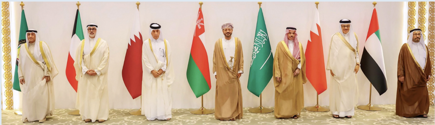
جاسم البديوي وجراح الجابر ووزراء خارجية دول التعاون

■ على مجلس الأمن ■ الاعتداء على أي دولة ■ الأعمال العدائية تباعد والمجتمع الدولي محاسبة من «دول التعاون» هو بين الشعوب وتقوّض إيران على عدوانها اعتداءً عليها جميعاً أسس الثقة وتزرع الشقاق ■ قدرات الدفاع المشترك ■ الاعتداءات لن تزيد شعوبنا تتصدّى للاعتداءات إلا تلاحماً وإصراراً على بكفاءة وجهوزية عاليتين مقاومتها والتصدّي لها