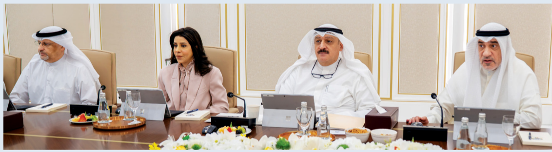
جانب من اجتماع مجلس الوزراء برئاسة اليموم

والمتكررة بما يتوافق مع القانون الدولي. كما أعرب مجلس الوزراء عن إدانته واستنكاره الشديدتين لاستمرار الاعتداءات الإيرانية الآثمة التي طالت أمس كلا من البحرين والأردن، في تصعيد خطير