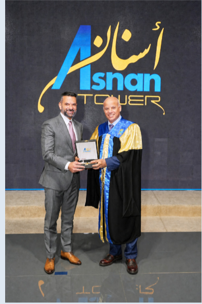
جانب من حفل التخرج

وأكد د بورزق أن «أسنان تاور» يؤمن بأن الاستثمار الحقيقي يكمن في تمكين الطاقات الوطنية الشابة ودعمها، مشيراً إلى أن مشاركة الخريجين هذه اللحظة تجسد ثمار العمل الدؤوب والالتزام بمعايير التميز المهني.