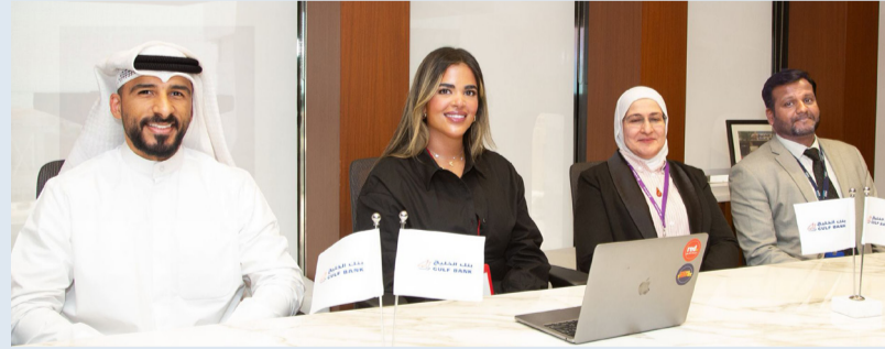
جانب من فعاليات السحب تحت إشراف مكاتب التدقيق