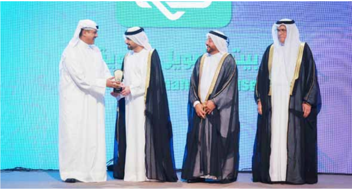
عبد الوهاب الرشود متسلماً للجائزة من نائب حاكم الشارقة سمو الشيخ عبدالله بن سالم القاسمي

في 2023.. تعكس مواصلة ريادته في صناعة التمويل الإسلامي