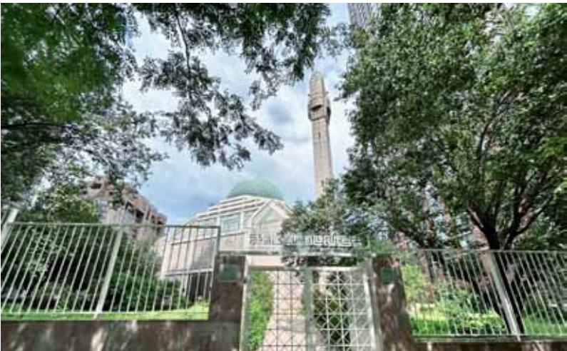
مبنى المركز الثقافي الإسلامي في نيويورك

وأعرب القنصل الكويتي عن خالص تمنياته لسمو أمير البلاد الشيخ مشعل الأحمد بدوام التوفيق والسداد لاستكمال