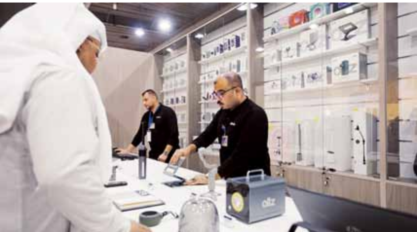
زين تقدّم مجموعة واسعة من المنتجات والحلول الذكية

والمؤسسات العاملة في مجالات التكنولوجيا المختلفة، لتقدّم أحدث خدماتها ومنتجاتها للزوار، مثل الاتصالات والإنترنت، والهواتف الذكية وأجهزة الكمبيوتر وإكسسواراتها، وتقنيات الألعاب الإلكترونية، وكاميرات التصوير ومعداتها.