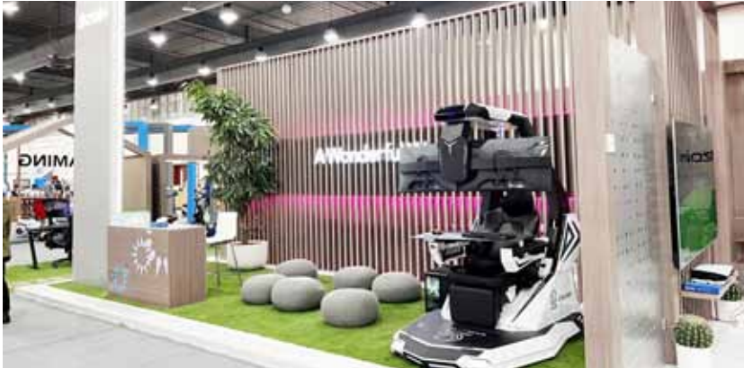
جناح «زين» في المعرض

وعبر جناحها الخاص في معرض MAX TECH، تقدّم «زين» حزمة واسعة من المنتجات الذكية والحلول والتطبيقات الرقمية في مختلف المجالات، مثل الهواتف والأجهزة الذكية وإكسسواراتها،