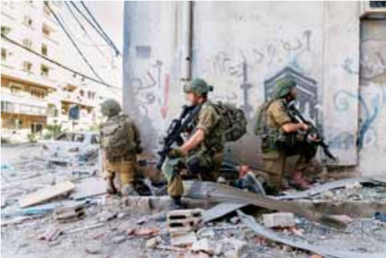
جنود صهاينة خلال توغّلهم شمالي غزة

فيما قالت هيئة البث العبرية كذلك إن رئيس حماس في غزة، يحيي السنوار، لديه «خطة منظمة» لإنهاء الحرب إذ يصر على انسحاب صهيوني من الأحياء المحتلة، ووقف طويل لإطلاق النار.