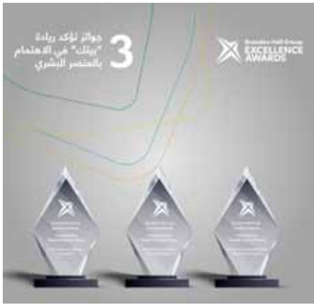
جوائز براندن هول

حصد بيت التمويل الكويتي (بيتك) 26 جائزة مرموقة على مستوى المجموعة من جهات محلية وعالمية مختلفة لعام 2023، إضافة إلى تصنيفه في المركز الأول محلياً من مجلة ذي بانكر العالمية. وختم «بيتك» عام 2023 بحصوله على 5 تصنيفات «رأى سوق» على مستوى الكويت من مجلة يوروموني العالمية، تأكيداً على مواصلة مسيرته الناجحة وريادته العالمية في صناعة التمويل الاسلامي، وتعزيزاً لسجله الحافل بالجوائز والتقديرَات العالمية.