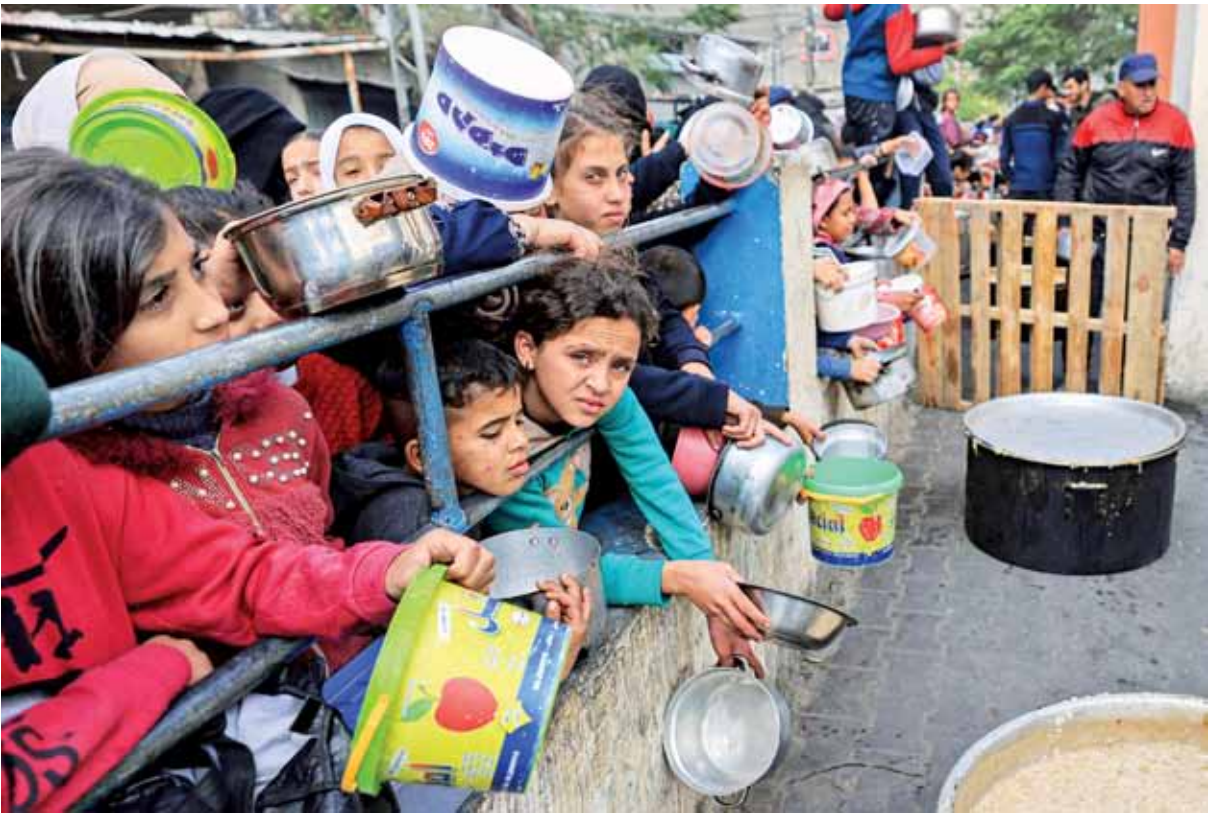
أطفال فلسطينيون منتظرين للحصول على الطعام عند نقطة تبرع في مخيم للاجئين في رفح جنوبي غزة أمس

■ الناطق باسم ال«أونروا»: نلمس ظاهرة الجوع في كل شارع.. الناس يريدون حتى رغيف خبز ■ «يونيسيف»: جميع الأطفال دون الخامسة معززون للوفاة جراء الهزال الشديد وسوء التغذية