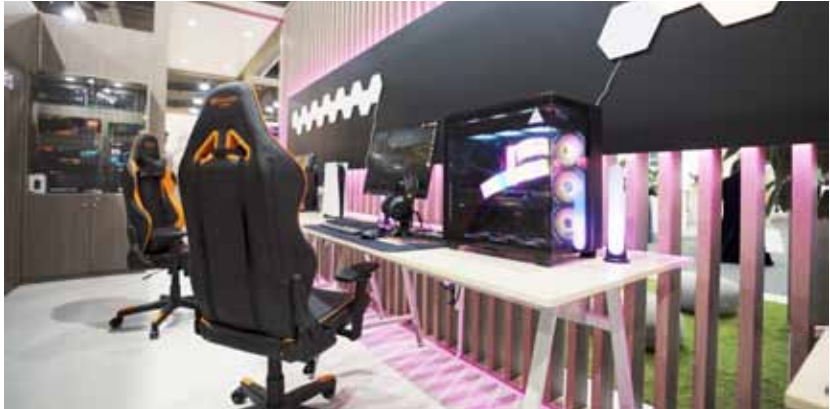
ركن خاص لعشاق الألعاب الإلكترونية